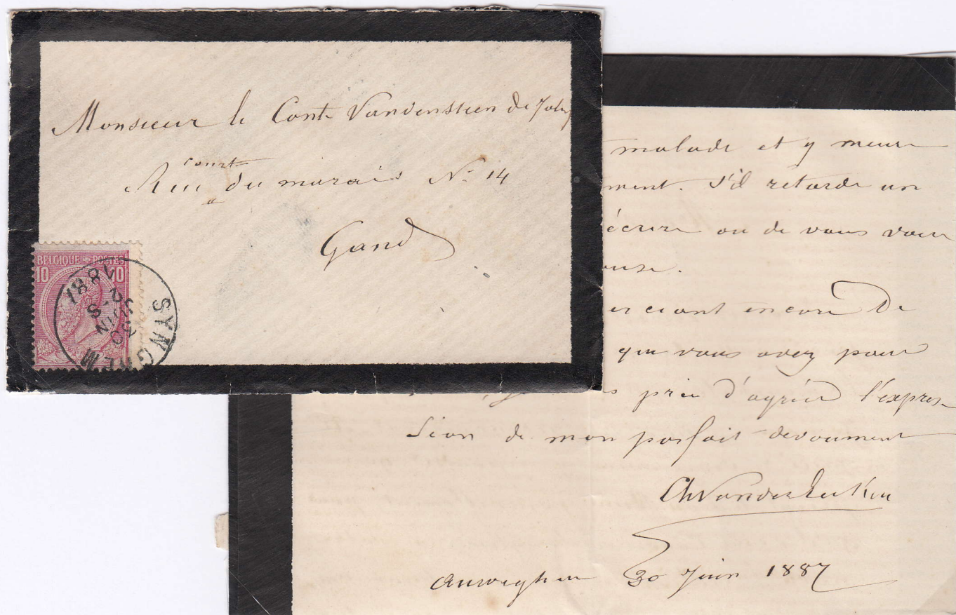
Brief verzonden vanuit SYNGHEM op 30 JUN 2-S 1887 naar Gent en er op de achterzijde afgestempeld GAND 30 JUN 7-S 1887. Op de achterzijde bevindt zich eveneens een postbodestempel.