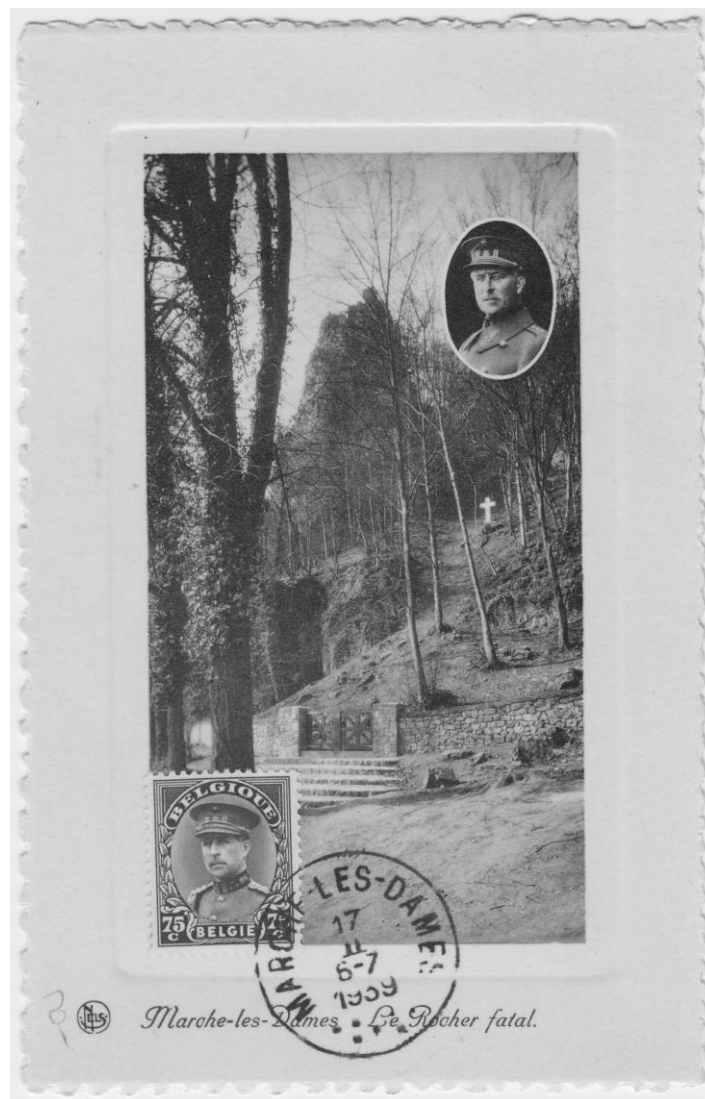
De kleur van de zegel (OBC 341) en de kaart is bruin

Op 10 maart 1934 werd in België een rouwzegel uitgegeven. Door tijdsgebrek, in een periode van crisis, werd voor de verwezenlijking van de rouwzegel gebruik gemaakt van de plaatproeven van de zegel die op 1 juni 1932 verscheen. Ze werden gekleefd op een getande achtergrond en de boorden werden nadien met Chinese inkt zwart gemaakt ( Beredeneerde catalogus van de Belgische postzegelproeven van 1910 tot heden, J. Stes )