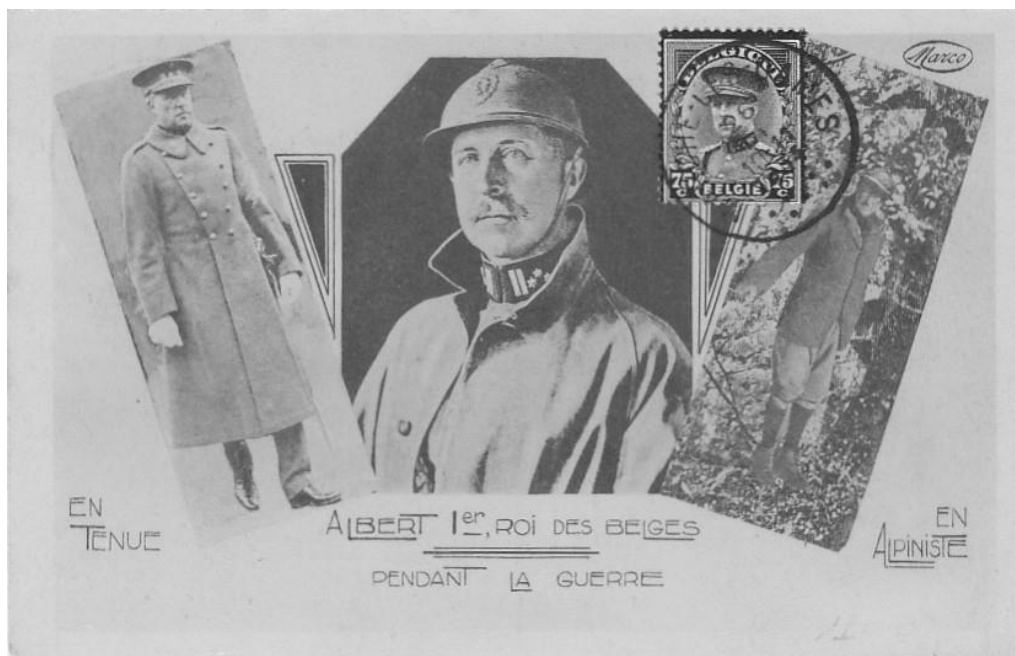
Originele kaart : kleur lichtbruin

Met "België verloor een bekwame en integere koning" en "het waarom" besluit de auteur met "daar ligt het geheim van zijn algemene populariteit".