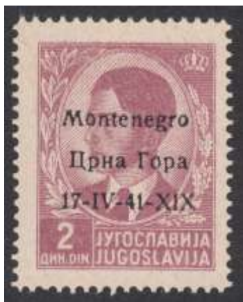
Yv. nr. 4

Nrs. 1/14: in vellen van 100 – zegel 12: verschillende karakters voor de 1 ste letter a – zegel 93: verschillende karakters voor de 2 de letter a – zegel 96: kopstaand cijfer 1 van 17 (BSa)