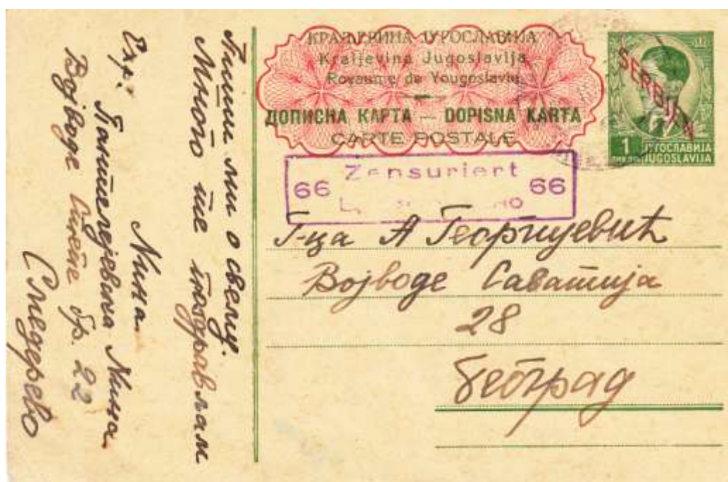
Postwaardestuk met de beeltenis van Peter II, waarde 1 dinar en met opdruk SERBIEN verstuurd op 23 november 1942. Kaart voorzien van een censuurstempel.