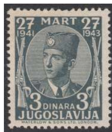
postzegel Yv. nr. 2

Op 27 maart 1943 wordt door de Joegoslavische regering in ballingschap te Londen een reeks van 4 postzegels uitgegeven met de beeltenis van de koning in militair uniform. Deze zegels met tanding 12 ½ dienden te worden gebruikt om alle poststukken te frankeren die in regeringskantoren en op de handelsschepen van de Joegoslavische regering in asiel ter verzending werden klaargemaakt. In hetzelfde jaar werden deze zegels ter ondersteuning van het Rode Kruis van een opdruk voorzien : CRVENI KRST + 12.50