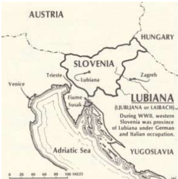
Slovenië – Ljubljana