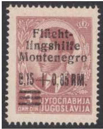
Mi. nr. 20