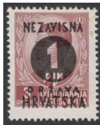
Yv. nr. 24

In de 2 de helft van 1944 liepen veel Kroatische soldaten over naar Tito's partizanen die, behalve Zagreb, omzeggens gans Kroatië hadden bezet. Het was wachten tot 7 mei 1945 toen de Duitse Wehrmacht capituleerde en de stad door de partizanen werd bevrijd.