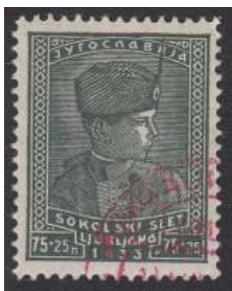
Zegel Yv. nr. 237

In oktober 1934 ging hij op staatsbezoek naar Frankrijk. Een kwartuur na aankomst in Marseille werd hij en de Franse minister van buitenlandse zaken Louis Barthou, naast elkaar zittend in de Koninklijke open auto, in opdracht van de Kroatische revolutionaire beweging Ustaša en het Macedonische IMRO, doodgeschoten. Ante Pavelić, hoofd van de Ustaša beweging werd hierom in Frankrijk bij verstek ter dood veroordeeld, doch door Italië, waar hij verbleef, niet uitgeleverd.