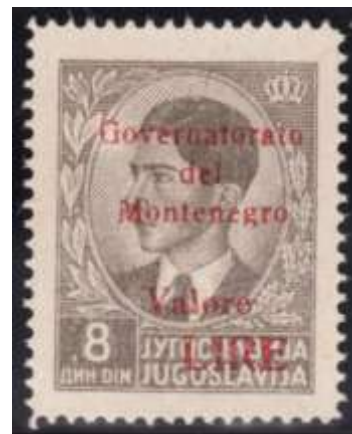
Mi. Nr. 41a

In juni 1941 werden twee reeksen Joegoslavische postzegels van 1939-1940 met opdruk rood en opdruk zwart uitgegeven met volgende tekst in 5 lijnen: Governatorato / del / Montenegro' / Valore / Lire (Gouverneurschap van Montenegro waarde lire). Onderstaande tabel bevat extra informatie.