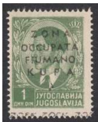
Yv. nr. 3

Nr. 18: opdruk MEMENTO AVDERE SEMPER + waardeanduiding in lire (BYMSa)