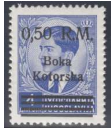
Kotor Mi. nr. 10

In de regio rond Kotor, tot september 1943 door de Italianen bij hun provincie Dalmatië gevoegd, werd in 1944 een postzegelreeks uitgegeven. Joegoslavische postzegels met de beeltenis van koning Peter II werden overdrukt met waarde aanduiding en tweelijnige tekst Boka / Kotorska. Onderstaande tabel zorgt voor meer duidelijkheid.