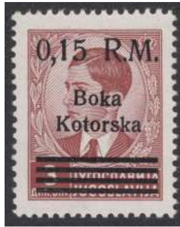
Kotor Mi. nr. 8