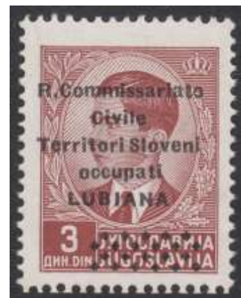
Yv. nr. 23

Op 3 mei 1941 werd een nieuwe reeks postzegels met opdruk “R. Commissariato Civile Territori Sloveni occupati Lubiana” (Rijksburgercommissaris voor het bezette Sloveense gebied, Ljubljana ) uitgegeven. Onderstaande tabel is een gedetailleerd overzicht.