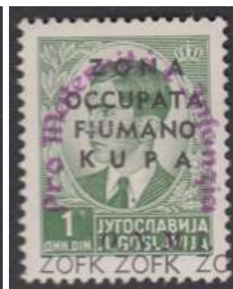
Yv. nr. 20

In 1942 werd een reeks van 3 zegels uitgegeven met opdruk zoals die van de postzegels Yv. nrs. 15/17 doch ook met Pro Maternità e Infanzia (voor het moederschap en het kind) in boogvorm en in verschillende opdruckkleur (lila – blauw – rood). De deze reeks werd klaargemaakt doch uiteindelijk niet uitgegeven. De postzegels waren geldig tot 26 mei 1942.