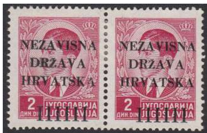
Yv. nr. 4 – tweede letter van HRVATSKA is onvolledig en het woord DRZAVA is onzuiver gedrukt op de postzegel links