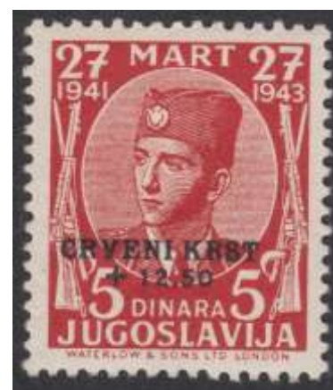
postzegel Yv. nr. 7

Meer informatie kan worden gevonden in de onderstaande tabel.