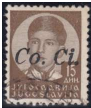
Yv. nr. 14