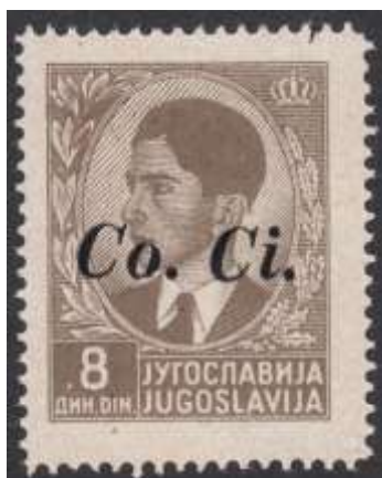
Yv. nr. 11

Oplage nrs 8 – 9 – 10 – 11 – 13 – 15: 13.000 ex – nr. 12 : 15.630 ex – nr. 14 : 1.135 ex – nr.16 : 9.840 ex – nr. 17 : 4.960 ex. (B) nr. 14: 1.147 ex – nr. 16: 10.000 ex – nr. 17: 5.000 ex