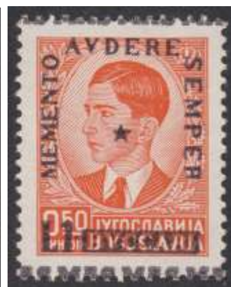
Yv. nr. 18