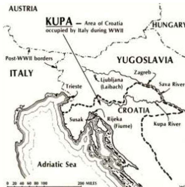
Fiume – Kupa (rivier)

Op 16 mei 1941 werd een zegelreeks uitgegeven die voor gebruik geldig was tot 26 mei 1942. Joegoslavische postzegels met de beeltenis van koning Peter II van 1939-1940 werden overdrukt met de tekst ZONA / OCCUPATA / FIUMANO / KUPA op 4 lijnen. Op de horizontale tussenruimten bevinden zich de letters ZOFK.