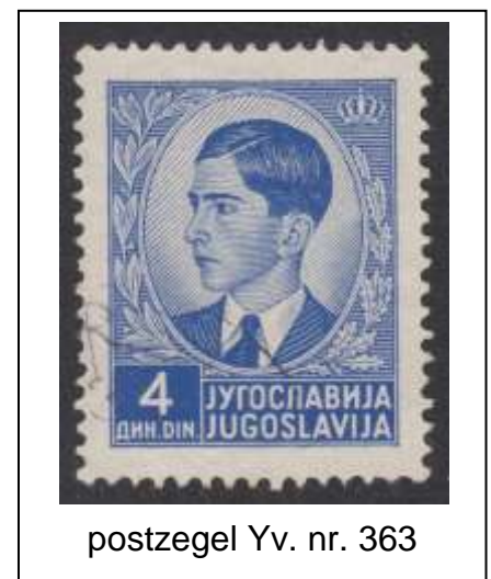
postzegel Yv. nr. 363