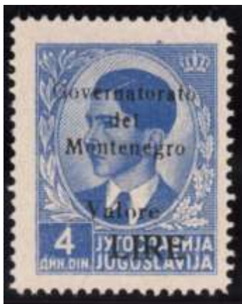
Mi. nr. 38b