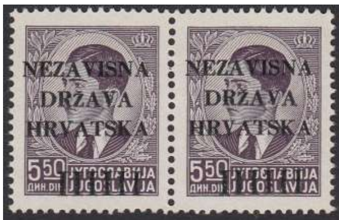
Yv. nr. 8 – links: de letter Z in DRZAVA is misvormd op de postzegel links