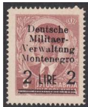
Mi. Nr. 4