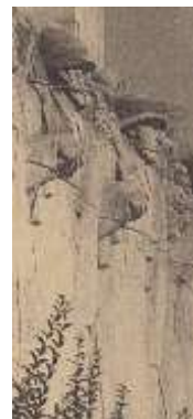
Beeldhouwwerk soldaten Vredesmonument