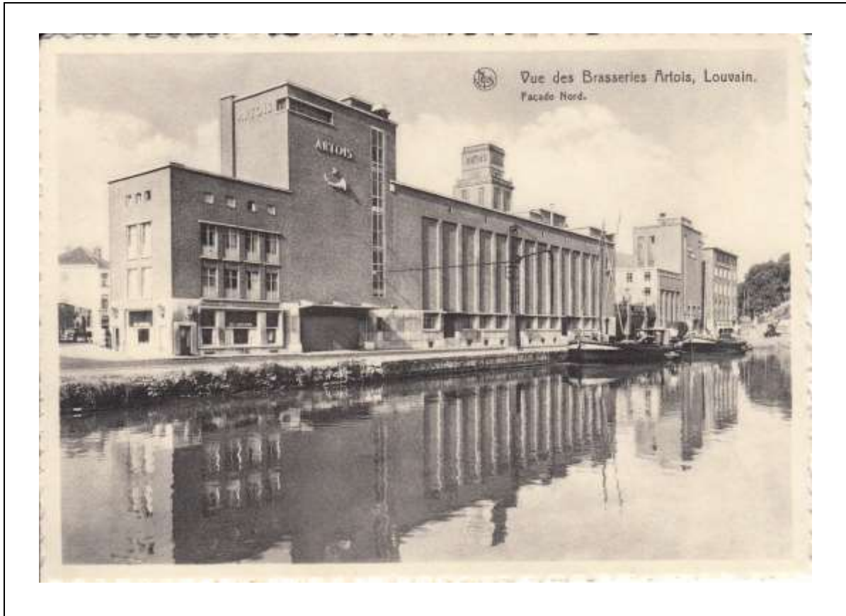
Postkaart Nels-Thill, met vermelding Photo Sergysels, Bruxelles, niet gelopen. Op een boogscheut van de Vaartvest lagen de - nu reeds gedeeltelijk afgebroken - brouwerij Artois; de trots van de Leuvenaars.