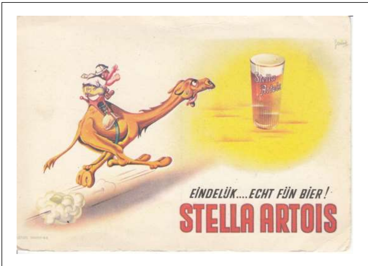
Postkaart met vermelding creation Vandam – K.H. en getekend Geesink, niet gelopen. Uiteraard kan men niet alleen in de buurt van de Vaartvest zijn dorst lessen met een frisse Stella !