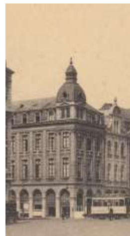
Hotel de l'Industrie