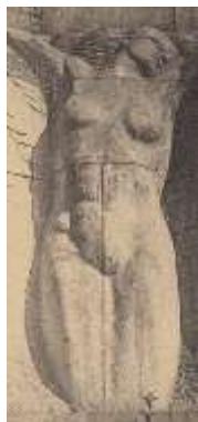
Beeldhouwwerk Lijdende Victorie Vredesmonument

Postkaart Nells met vermelding Photo Becker, Bruxelles en Copyright by Marcel Wolfers and A. De Bondt, niet gelopen. Wanneer men van op de Tiensevest dichterbij naar het Vredesmonument wandelt kan men van dichtbij de bas-reliëfs gedetailleerd bewonderen. In 2004 werd, na vele jaren van verkommering en overwoekering door wilde plantengroei, een grondige restauratie van het Vredes-monument doorgevoerd. Tijdens de tweede wereld-oorlog werd het monument ernstig vernield. In op-dracht van de Duitsers werden Leuvenaars aangeduid die verplicht werden om de bas-reliëfs weg te hakken. De afbeelding van de oneervolle vlucht van de Duitsers tijdens de eerste wereldoorlog was hun immers een doorn in het oog.