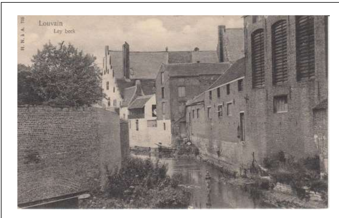
Postkaart, niet gelopen. De Leibeek vormde samen met de Dijle de Tweewaters, een romantisch stukje natuur tussen de Vaart en de binnenstad.

De Dijle kronkelde ooit in het waterrijke Loobroek samen met de Leibeek. Bij de aanleg van de Vaartkom in 1750 werd de oude bedding van de Dijle opgeheven door ze op te vullen met aarde en te verplaatsen. De zo ontstane Nieuwe Dijle werd op een afstand van de Vaart parallel met de Leibeek gegraven. Tussen de Nieuwe Dijle en de Vaart werden de terreinen bouwklaar gemaakt voor de industriële ontwikkeling, die met de nodige vernieuwingen, vandaag nog steeds doorgaat. Waar nu de Leibeek onder de Diestsevest doorloopt, stond indertijd de waterpoort 'het Nieuwwerk', die in 1561 als extra versterking werd gebouwd. Een uitkijktoren stond boven de doorgang van de Leibeek. Bij de aanleg van de Vaart werd de kronkelende Dijlebedding verplaatst en naast de Leibeek heraangelegd vooraleer de stad te verlaten. De Tweewaters werden zo geboren. Ze vormen samen met het Montfortanenpark, een oase van rust, die vandaag echter bedreigd wordt door de ontmanteling van dit park voor een zoveelste woonblok.