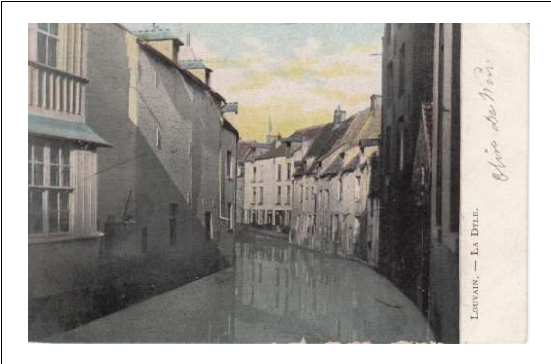
Postkaart, zonder vermelding uitgever, gelopen 1906. De belangrijkste rivier in Leuven was ongetwijfeld de Dijle.

De Dijle kronkelde ooit in het waterrijke Loobroek samen met de Leibeek. Bij de aanleg van de Vaartkom in 1750 werd de oude bedding van de Dijle opgeheven door ze op te vullen met aarde en te verplaatsen. De zo ontstane Nieuwe Dijle werd op een afstand van de Vaart parallel met de Leibeek gegraven. Tussen de Nieuwe Dijle en de Vaart werden de terreinen bouwklaar gemaakt voor de industriële ontwikkeling, die met de nodige vernieuwingen, vandaag nog steeds doorgaat. Waar nu de Leibeek onder de Diestsevest doorloopt, stond indertijd de waterpoort 'het Nieuwwerk', die in 1561 als extra versterking werd gebouwd. Een uitkijktoren stond boven de doorgang van de Leibeek. Bij de aanleg van de Vaart werd de kronkelende Dijlebedding verplaatst en naast de Leibeek heraangelegd vooraleer de stad te verlaten. De Tweewaters werden zo geboren. Ze vormen samen met het Montfortanenpark, een oase van rust, die vandaag echter bedreigd wordt door de ontmanteling van dit park voor een zoveelste woonblok.