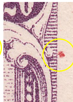
zegel 19 op paneel 2 van de 5 en 20 c