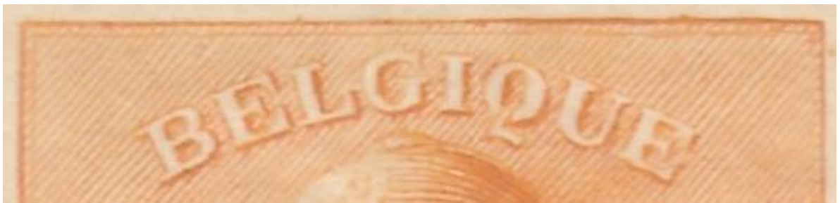
Zegel 15 : Bijgewerkte kader rechter bovenhoek.