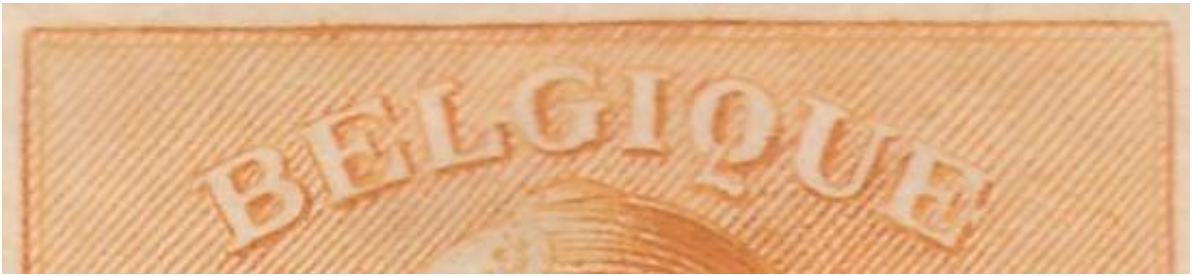
Zegel 7 : Diagonale lijnen in de linker bovenhoek.