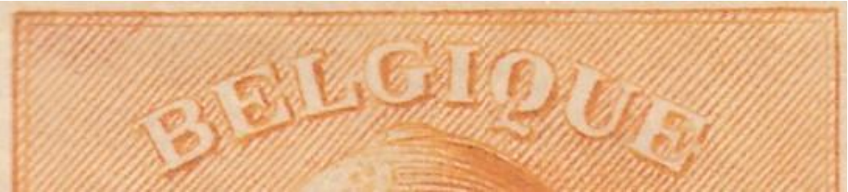
Zegel 12 : Verdikking van de bovenste kaderlijn tussen de I van Belgique en de rechter bovenhoek.