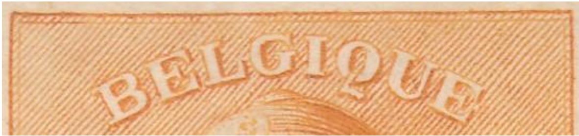
Zegel 22 : Bijgewerkte bovenste kader van de linker hoek tot de U van Belgique.