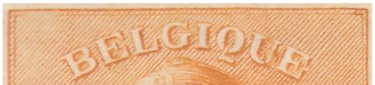
Zegel 20 : Bijgewerkte bovenste kader links.