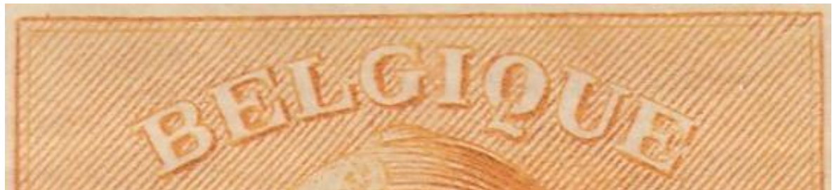
Zegel 19 : Bijgewerkte rechter bovenhoek en linker kader van de bovenhoek tot de onderkant van de B van Belgique.