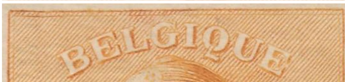
Zegel nr. 23 van plaat 1 ( boven) en plaat 3 ( onder).