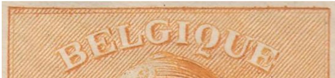
Zegel 24 : Vervormde binnenste kader boven BE van Belgique.