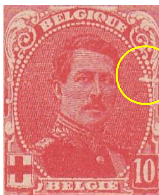
paneel 1 – zegel 72

Zegelreeks 129/131: de enige variëteit in deze reeks die in de catalogus staat, is de 10 c zegel op positie 72 van het bovenste paneel (1) van 150 zegels. Er zijn nog plaatfouten die van de zelfde grootteorde en door hun ligging duidelijk zichtbaar zijn.