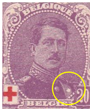
paneel 1 – zegel 92