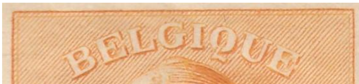
Afbeelding van de het bovenste deel van een niet bijgewerkte zegel.

We besluiten de beschikbare vellen en veldelen aan een grondig onderzoek te onderwerpen en vinden in de literatuur hulp in "Emission de la libération dite "Roi casqué", E. & M. Deneumostier.