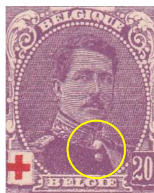
paneel 1 – zegel 145