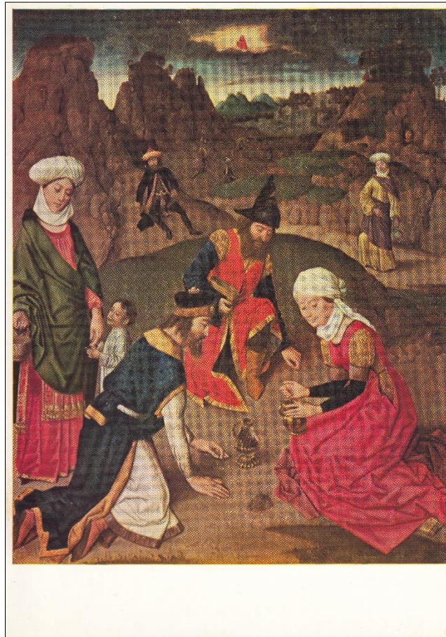
5. Dirk Bouts, Mannaogst