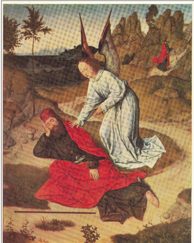
4. Elias in de Woestijn