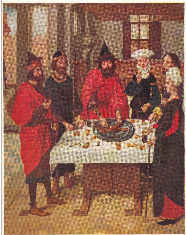
2. Dirk Bouts, Paasmaal