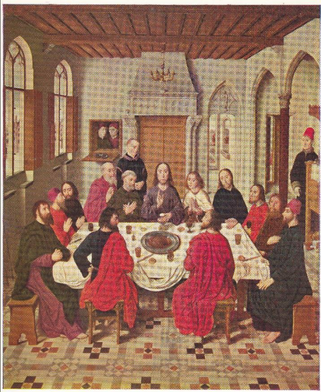
1. Dirk Bouts, Het Laatste Avondmaal