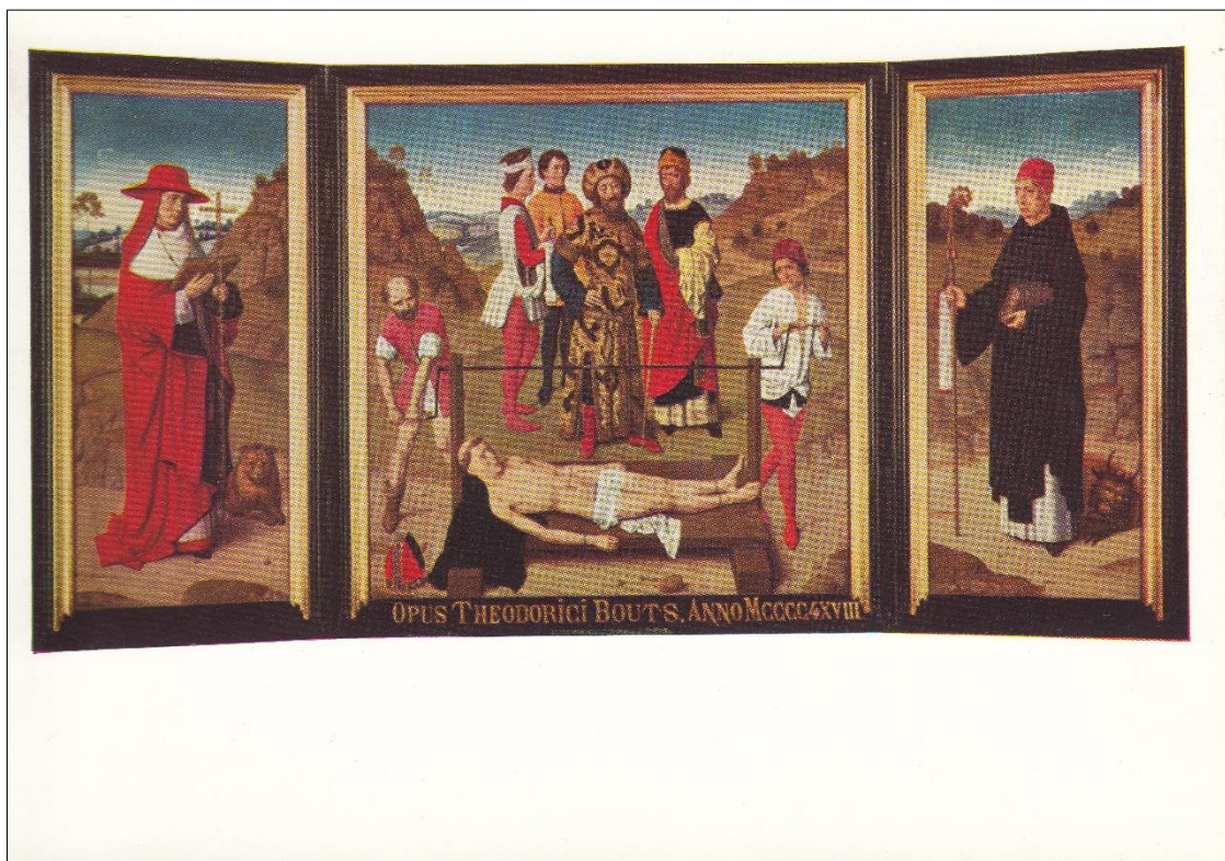
6. Dirk Bouts, Marteling van de Heilige Erasmus

We verlaten even de hoofse sferen van Dirk Bouts en belanden terug met de voetjes op de grond in de realiteit van elke dag. Een kritische noot is dus nooit veraf ! En deze realiteit gaat, in tegenstelling tot Bouts schilderkunst, wèl met heel wat emotie gepaard.