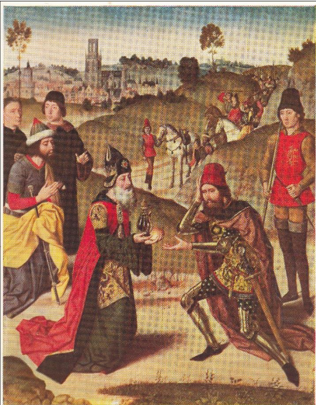
3. Dirk Bouts, Abraham en Melchisedech