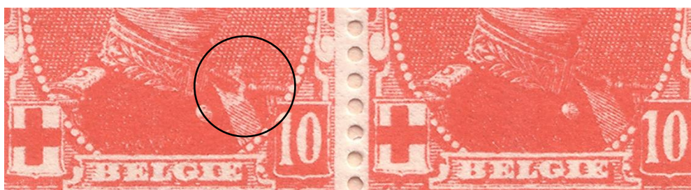
V3 – zegelnummers 58 (met) en 59 (zonder) van het onderste veldeel