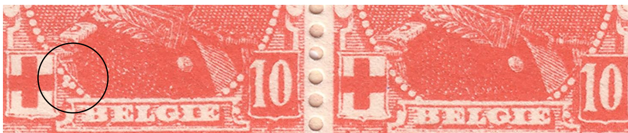
V4 – zegelnummers 106 (met) en 107 (zonder) van het onderste veldeel