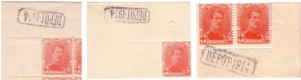
Hoekstuk van een echt vel