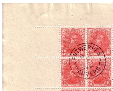
Afstempeling Antwerpen 1 A-L 11-12 7 X 1914 (vals gebruik gekend)