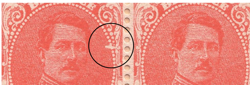
V1 – zegelnummers 72 (met) en 73 (zonder) van het bovenste veldeel

Bij nader onderzoek van verschillende vellen (*) blijkt dat op de zegelnummers 51 (bovenste veldeel – type I) alsook 58 en 106 (beide onderste veldeel – resp. type II en I) steeds een belangrijke afwijking in de tekening voorkomt. Deze verschillen die op deze vellen voorkomen, zijn zoals de afwijkende tekening op zegel nummer 72 van het bovenste veldeel variëteiten en geen druktoevalligheden . Ze kunnen omschreven worden als resp. “wit punt op rechterkant van de borst (V2)”, “witte vlek aan de linkerschouder (V3)” en “extra parel naast het Rode Kruis schild (V4)”.