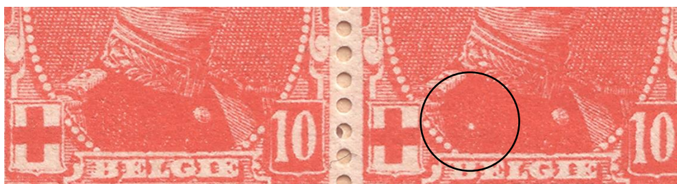
V2 – zegelnummers 50 (zonder) en 51 (met) van het bovenste veldeel

Bij nader onderzoek van verschillende vellen (*) blijkt dat op de zegelnummers 51 (bovenste veldeel – type I) alsook 58 en 106 (beide onderste veldeel – resp. type II en I) steeds een belangrijke afwijking in de tekening voorkomt. Deze verschillen die op deze vellen voorkomen, zijn zoals de afwijkende tekening op zegel nummer 72 van het bovenste veldeel variëteiten en geen druktoevalligheden . Ze kunnen omschreven worden als resp. “wit punt op rechterkant van de borst (V2)”, “witte vlek aan de linkerschouder (V3)” en “extra parel naast het Rode Kruis schild (V4)”.