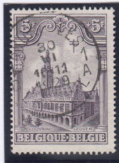
Bruxelles-Brussel 1 30.06.1929