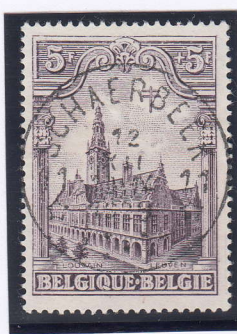
Schaerbeek 1 12.12.1928