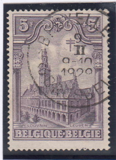
Brussel-Bruxelles 1 09.02.1929