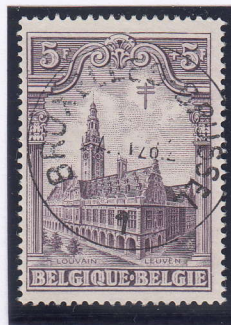
Bruxelles -Brussel 27.12.1928