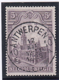
Antwerpen 10 12.12.1928

Door de hoge waarde van de postzegel en de korte gebruiksperiode is het gebruik ervan eerder beperkt. Het briefport voor een standaardbrief naar het buitenland bedroeg 1,75 Fr tot het einde van WO II.