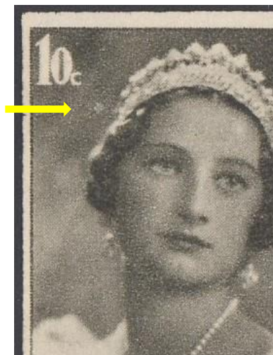
1 (1 van 2)