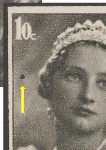
44 (1 van 2)