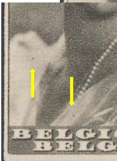
12 (2 van 5)