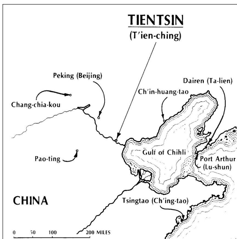
Kaart 2 (uit: Where in the World)

Niet voor het eerst, ditmaal binnen een geheim genootschap, de Boksers (rituele vuistvechters), groeide in China de weerstand tegen de buitenlandse invloeden en hun handelsactiviteiten uit tot een opstand: naast het vernielen van spoorwegen en telegraafverbindingen werden voornamelijk de buitenlandse missionarissen, Chinese bekeerlingen, Japanners en westerlingen van hun bezittingen beroofd of vermoord. In juni 1900 werden Tientsin (Tianjin) en Peking belegerd en de Duitse gezant werd tijdens de onderhandelingen om het leven gebracht. Een internationale interventiemacht, waarvan Italië deel uitmaakte, werd naar China gestuurd. De diplomaten werden ontzet, de Boksers verslagen en harde vredesvoorwaarden werden gesteld. De westerse landen kregen opnieuw controle over de belangrijke haven en het industriële centrum Tientsin, zo'n 130 km van Peking (kaart 2). Vanaf 7 juni 1902 werd de op 7 september 1901 door Italië verworven concessie administratief geleid door de consul. Italiaanse postzegels met opdruk Tientsin werden gebruikt tussen 1917 en 1921. In 1947 werd deze concessie overgedragen aan de Chinese Volksrepubliek.