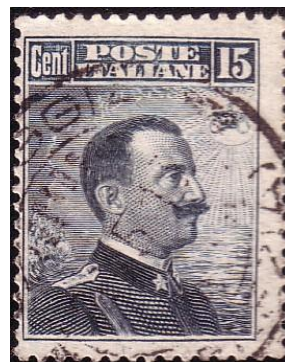
Y82 - Type G