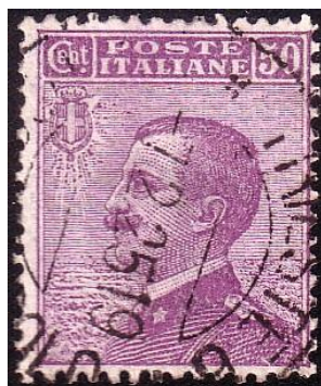
Y81 - Type F