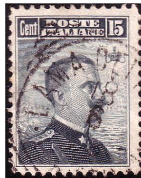
Y78 - Type D