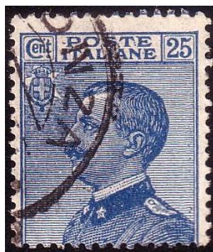
Y79 -Type E