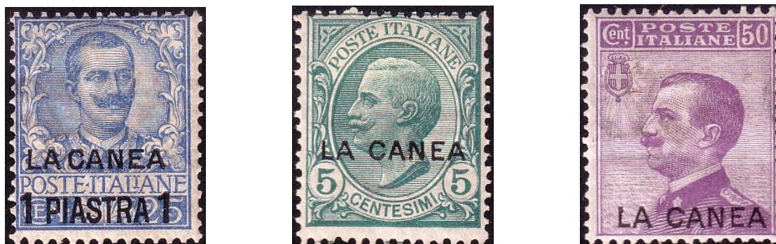
Fig. 3 – v.l.n.r., nr. Y2 – type A , Y14 – type C, Y19 – type F.

correspondentie. Het eiland Kreta in de Middellandse zee was reeds rond 1881 opgedeeld in administratieve zones, waar de grote mogendheden, Groot-Britannië, Rusland, Oostenrijk, Frankrijk en Italië, verschillende postkantoren open hielden. Italië had een postkantoor in La Canéa. In 1908 bevestigde het parlement op Kreta zijn verbondenheid met Griekenland. Na de hereniging op 14 december 1913 werden Griekse zegels gebruikt; doch het Italiaanse kantoor werkte nog tot 31 december 1914. Tabel III vat de postzegeluitgiften met opdruk en met de beeltenis van Victor-Emmanuel III die er werden gebruikt, samen.