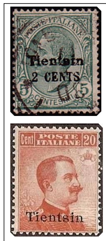
Fig. 2 - nr. Y9 en Y16A

In tabel II werden de postzegeluitgiften met opdruk en met de beeltenis van Victor-Emmanuel III samengebracht.