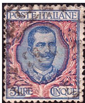
Y74 - Type B