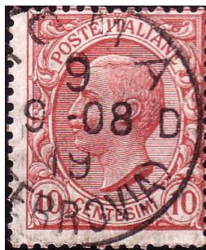
Y77 -Type C