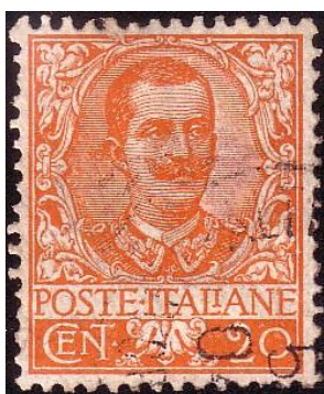
Y68 -Type A

Op 1 juli 1901 gaf de Italiaanse post de eerste postzegels met de beeltenis van koning Victor-Emmanuel III uit. Naast enkele postzegels die het wapenschild van het Huis van Savoye tonen, werden in dat jaar nog 8 postzegels uitgegeven met twee verschillende lay-outs. Tussen 1906 en 1911 werden postzegels met 5 verschillende types uitgegeven. Voor meer informatie over deze types, hier A tot G genoemd, en over de waarden met hetzelfde zegelbeeld die voor het uitbreken van WO I werden uitgegeven, wordt verwezen naar fig. 1 en tabel I.