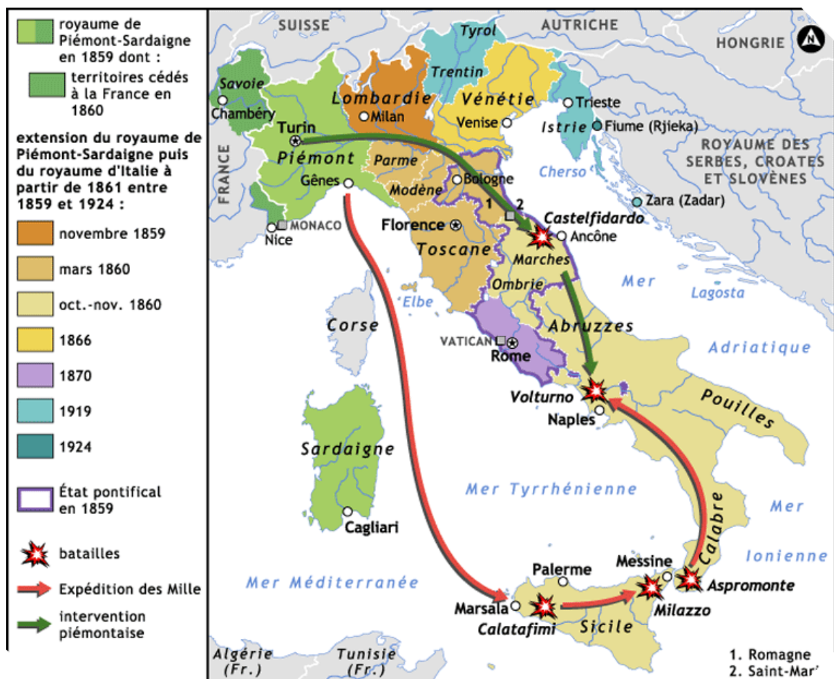
Kaart 1 - De Italiaanse éénmaking (uit: www.atlas-historique.net )