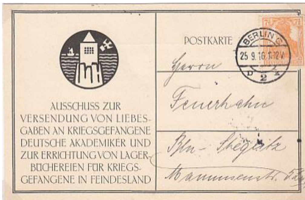
Postkaart nationaal verstuurd vanuit Berlijn op 25 september 1916, hetzij na invoering van de tariefverhoging: gefrankeerd met 7,5 Pfennig

In augustus 1918 beseftte de Duitse legerleiding dat men de oorlog niet kon winnen. De opstand van Duitse matrozen in Kiel begin november 1918 leidde tot nationale stakingen. De revolutie van 9 november 1918 betekende het einde van het keizerrijk. Duitsland kon onmogelijk verder vechten en de start van de vredesonderhandelingen, zoals eerst voorzien, op langere termijn inplannen. Hierdoor eisten de geallieerden de onmiddellijke en volledige capitulatie en een schadevergoeding.