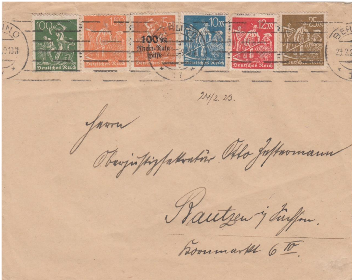
Brief verzonden van Berlijn op 23 februari 1923 en gefrankeerd met Mi. nrs. 187-189-239-240-242-258 voor een totale waarde van 54,5 Mark. Tariefperiode 15.01.1923 t.e.m. 01.03.1923. Port: 50 Mark voor een brief <20 g.

de zegel met waarde 20 + 1000 Mark (Mi.nr. 260) bestaat niet getand alsook met kop staande opdruk, dubbele of kop staande druk van het beeld.