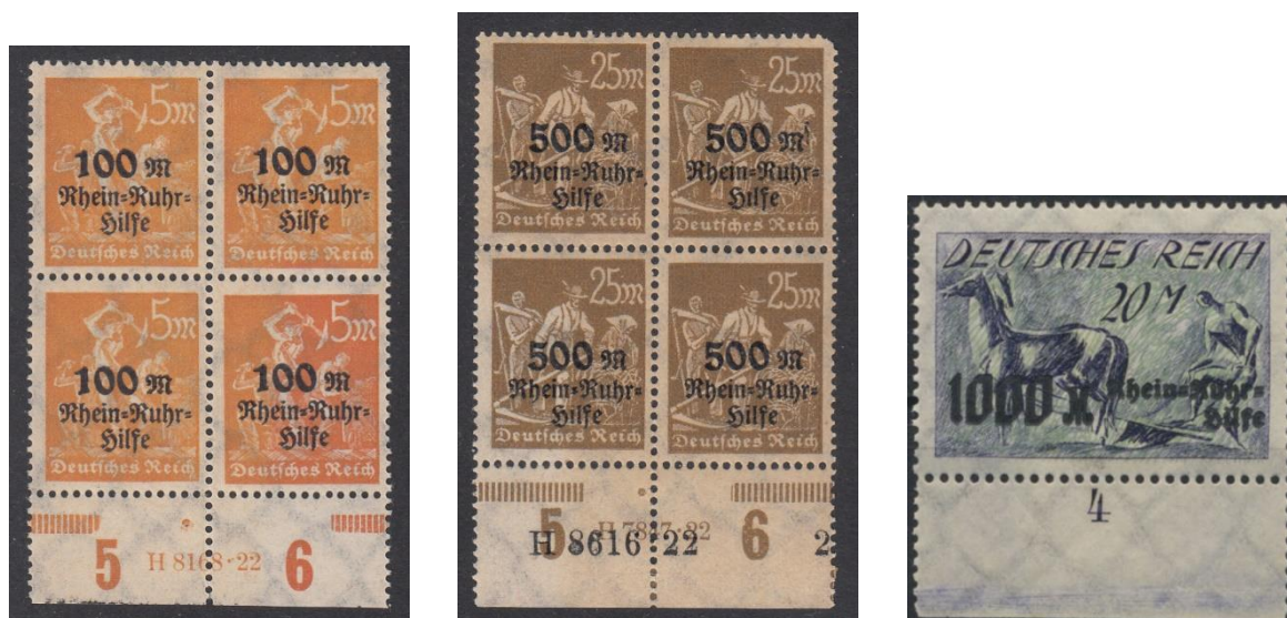
Mi. nrs. 258 / 260 met huisbestel- of opdrachtnummer HAN 8616 22 in de onderste velrand voor de zegel van 25 Mark

Uitgifteaantal: 10 miljoen voor de waarde 5+100 Mark, 5 miljoen voor de waarde 25 + 500 Mark en 1 miljoen voor de waarde 20 + 1000 Mark.