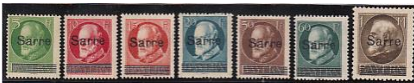
Postzegels van Beieren met de beeltenis van koning Ludwig III met opdruk voor gebruik in Saarland

Op het einde van Wereldoorlog I waren er nog twee van de oorspronkelijke koninkrijken die postzegels uitgaven: Beieren en Württemberg.