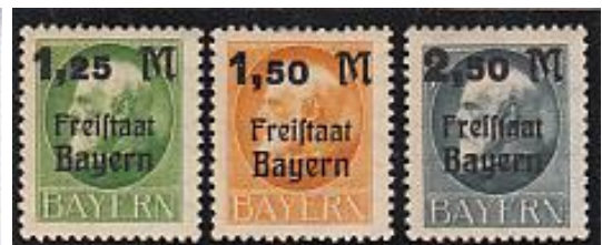
Uitgegeven 1 maart 1920