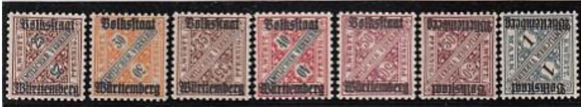
Dienstzegels met opdruk, uitgegeven in 1919 voor staatsambtenaren van de republiek Württemberg (Mi.nrs. 258 /270)