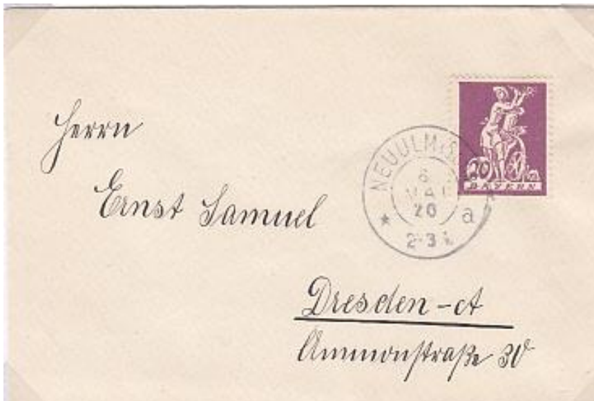
Brief verstuurd van Neu-Ulm naar Dresden op 6 mei 1920, de 1 ste dag van de tariefperiode die liep t.e.m. 31 maart 1921. Voldaan met zegel Mi. nr. 181 (20 Pfennig)

Door de volksofstand in november 1918 werd koning Lodewijk III afgezet. Tijdens de woelige politieke periode die hierop volgde bleef de Beierse post haar werk doen.