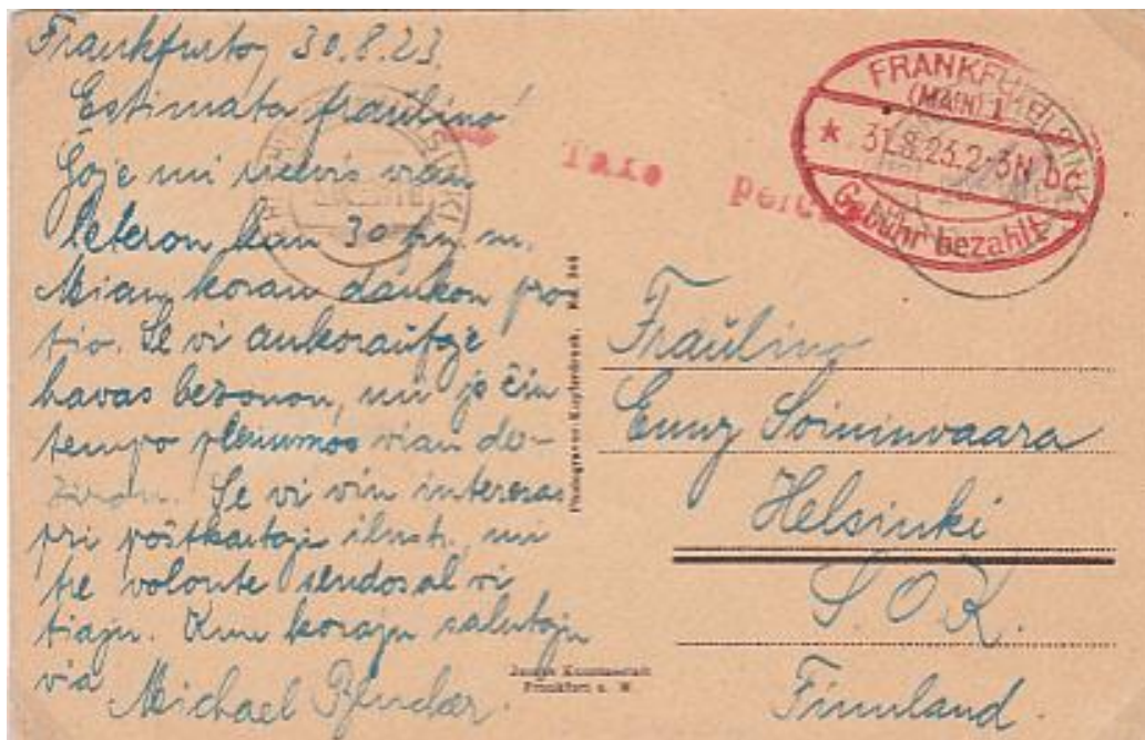
Postkaart verstuurd van Frankfurt naar Helsinki, Finland en afgestempeld op 31 augustus 1923. Tarief in de periode 24.08.1923 t.e.m. 31.08.1923 <20 g bedroeg 20.000 Mark. Betaald aan het loket.

In oktober / november werden de tijdsintervallen tussen de forse verhogingen van de porten zo klein dat de uitgifte van een nieuwe reeks postzegels waarvan tijd op het drukken werd bespaard. Er zijn geen officiële uitgiftedatum bekend, doch de vroegste afstempeling op de serie met rozettenpatroon is 9 oktober 1923. Oorspronkelijk was het de bedoeling om vellen met het postzegelbeeld te drukken die konden gestockeerd worden, doch dit bleek bij walsdruk niet realiseerbaar omdat de waarde opdruk onmiddellijk door een tweede drukcilinder moest gebeuren.