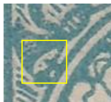
Walsdruk met visoog

Op 12 november 2023 bedroeg het port voor een brief tot 20 g tien miljard Mark. De 500 miljoen zegel werd pas op 2 november de eerste maal afgestempeld, de 200 miljoen zegel pas op 5 november, de eerste dag van de tariefperiode 5.11.1923 t.e.m. 11.11.1923. Om verwarring te vermijden werd het woord "Milliarden" cursief gedrukt.