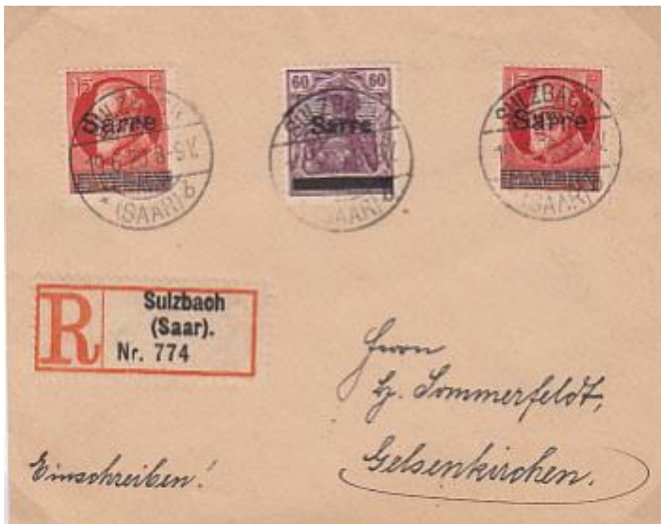
Aangetekende brief verzonden op 19.06.1920 van Sulzbach naar Gelsenkirchen met Beierse- en Reichpostzegels voorzien van een opdruk. Het port 90 Pfennig is correct.

Met het Verdrag van Versailles werden door het Duitse Rijk verschillende gebieden afgestaan aan de geallieerde landen. Saarland, samengesteld uit de Pruisische Rijnprovincie en de Beierse enclave Palts, kwam onder bestuur van de Volkenbond. De mijnen in dit gebied werden voor 15 jaar aan de Fransen toegewezen. Dit Duits gebied werd dus in die periode niet belast met de hyperinflatie. Er werden postzegels van Beieren en het Duitse Rijk met opdruk Sarre (Franse naam voor Saarland) en 4 of 5 horizontale lijnen gebruikt.