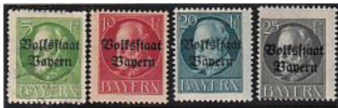
Uitgegeven 17 december 1919 tot 17 januari 1920