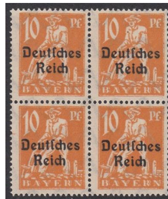
Mi. nr. 120

In 1920 werden postzegels van Beieren (Mi. nrs. 178/195) overdrukt met de naam "Deutsches Reich" (gecatalogeerd als Mi. nrs. 119/138).