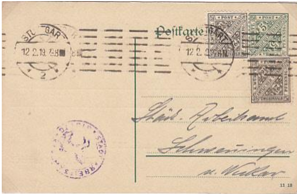
Postkaart verstuurd op 12.02.1919 van Stuttgart naar Arbeitsamt te Wetzlar. Het tarief van 10 Pfennig, werd voldaan met zegels Mi.nrs.209-237 (2x)

De laatste postrechten werden overgedragen aan het Duitse Rijk op 1 april 1920 tegen betaling van 225 miljoen Mark, die de Württemberg dienstzegels met opdruk "Deutsches Reich" gebruikte voor gans Duitsland