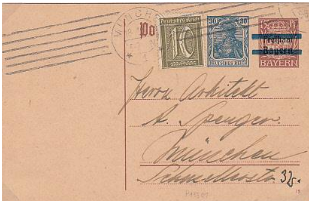
Postwaardestuk met vernietigde opdruk "Freistaat Bayern" en nieuw gedrukte zegelwaarde van het Duitse Rijk, verstuurd op 18 oktober 1921 - Correct tarief 40 Pfennig