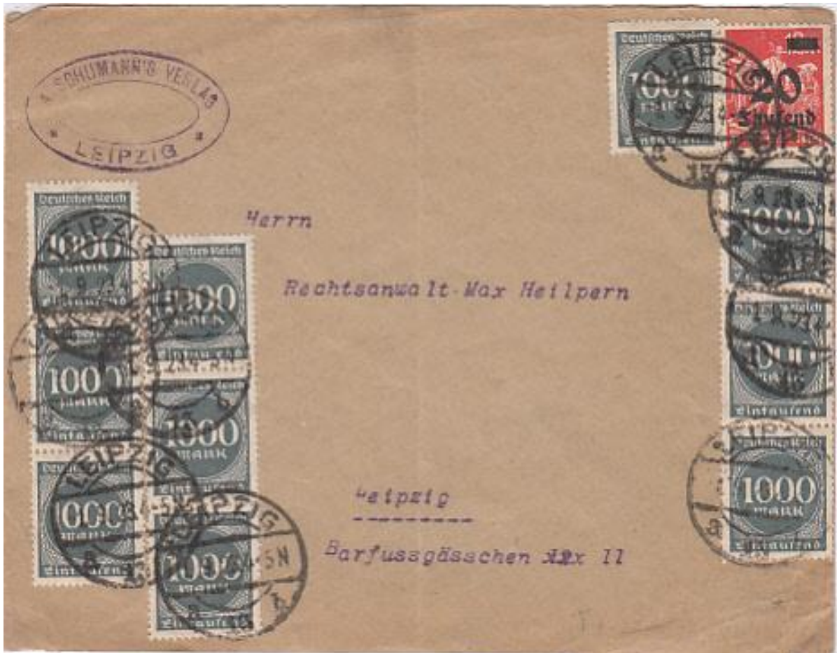
Brief verstuurd en besteld in Leipzig op de eerste dag van de tariefperiode 01.09.1923 t.e.m. 19.09.1923. Tarief 30.000 Mark. Voldaan met zegels Mi.nrs. 252 (10x) en 280.