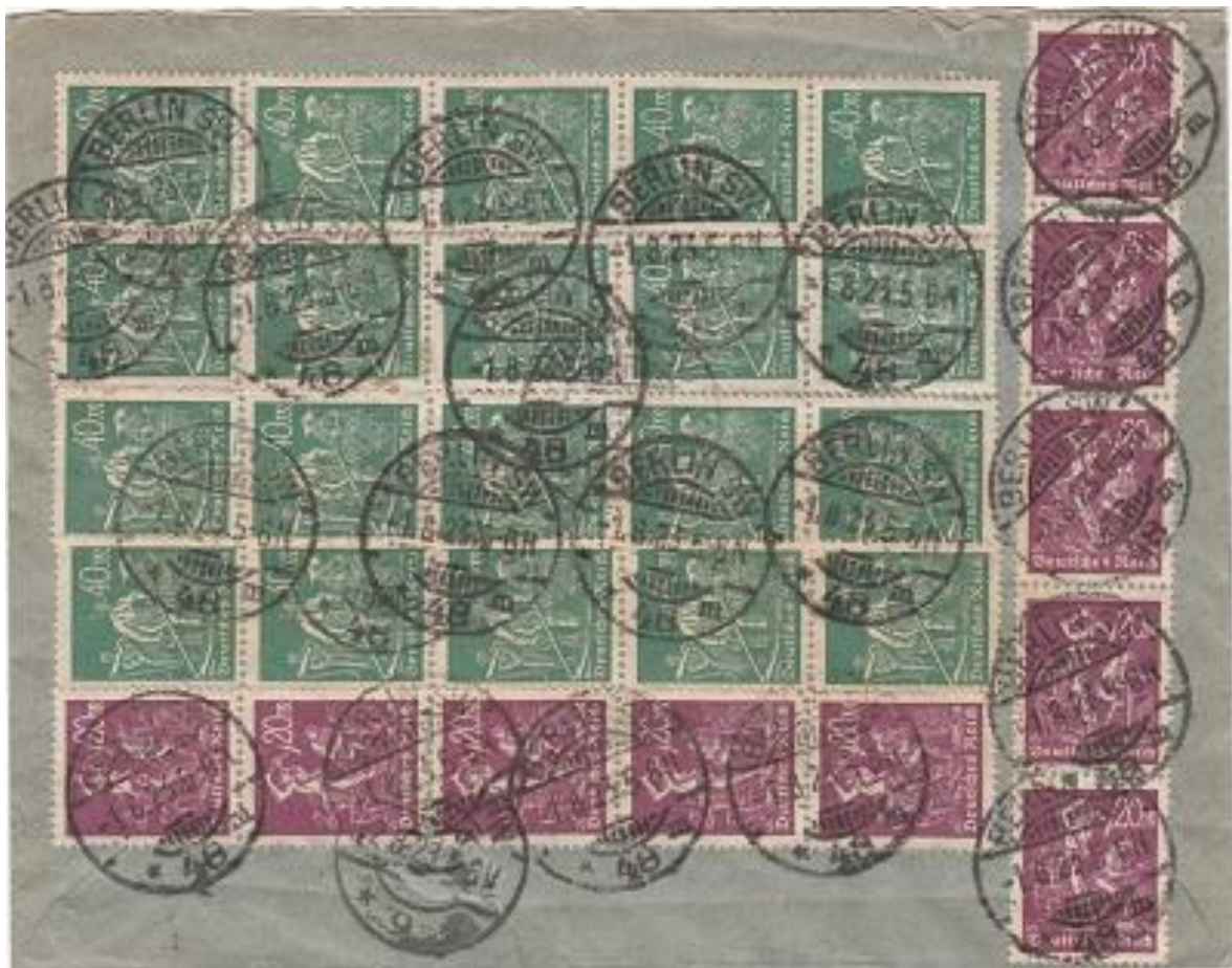
Recto en verso van de aangetekende brief die lokaal verstuurd werd in Berlijn op de eerste dag van de tariefperiode 01.08.1923 t.e.m. 23.08.1923. Aantekenrecht was 400 Mark en het port voor een lokale brief <20 g bedroeg 1000 Mark samen 1400 Mark. Voldaan door postzegels Mi. nr. 248, 268 (2x), 241 (10x) en 244 (20x)