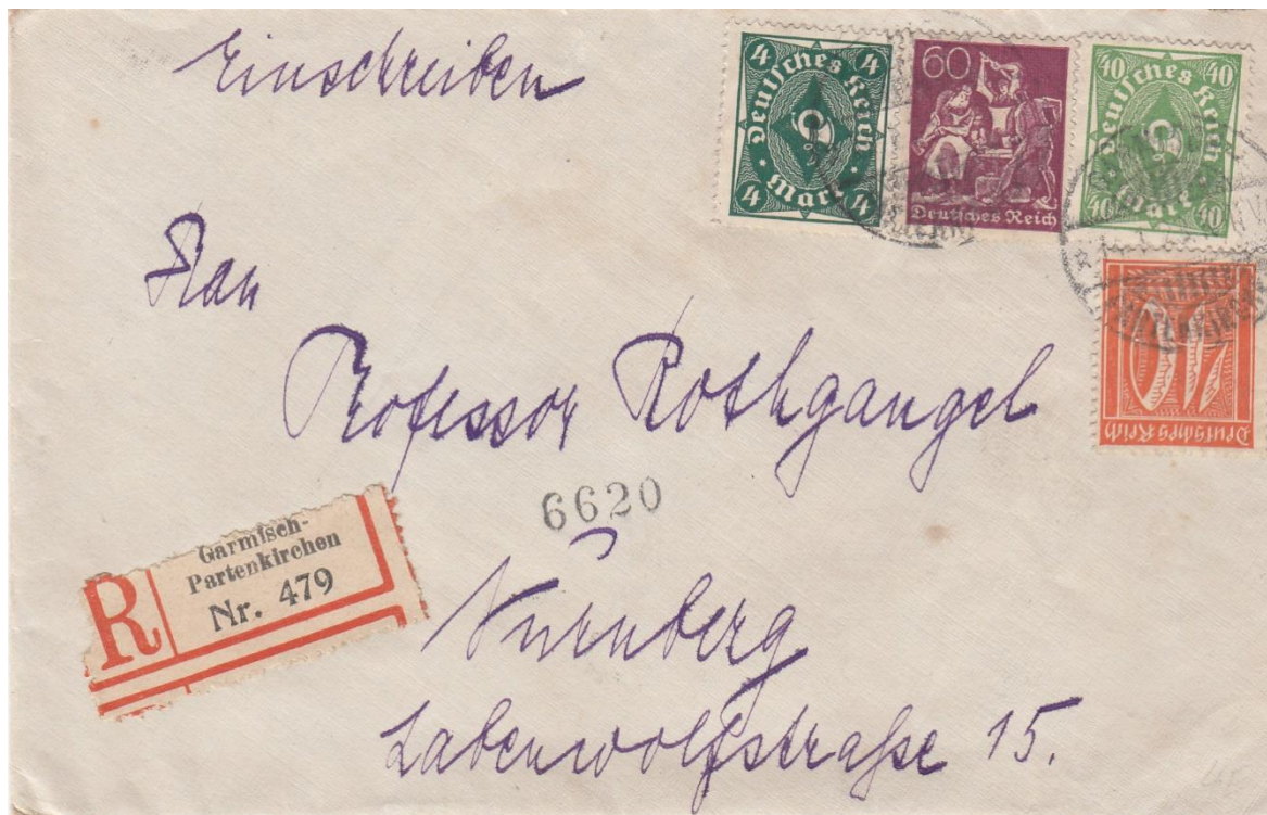
Aangetekende brief verstuurd op de laatste dag van de tariefperiode 15.12.1922 t.e.m. 14.01.1923 van Garmisch-Partenkirchen naar Nürnberg. Tarief: 25 Mark voor een gewone brief en 20 Mark aantekentaks, totaal 45 Mark. Correct gefrankeerd met zegels nrs. 182 - 184 - 226 en 232.