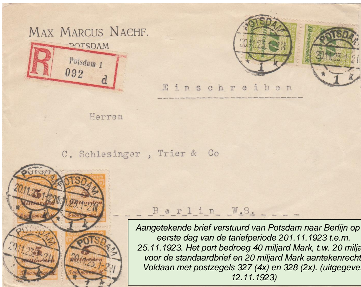
Aangetekende brief verstuurd van Potsdam naar Berlijn op de eerste dag van de tariefperiode 20.11.1923 t.e.m. 25.11.1923. Het port bedroeg 40 miljard Mark, t.w. 20 miljard voor de standaardbrief en 20 miljard Mark aantekenrecht. Voldaan met postzegels 327 (4x) en 328 (2x). (uitgegeven 12.11.1923)