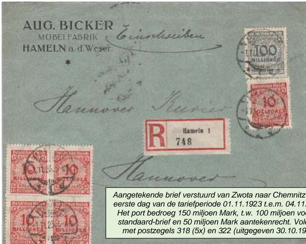
Aangetekende brief verstuurd van Zwota naar Chemnitz op de eerste dag van de tariefperiode 01.11.1923 t.e.m. 04.11.1923. Het port bedroeg 150 miljoen Mark, t.w. 100 miljoen voor de standaard-brief en 50 miljoen Mark aantekenrecht. Voldaan met postzegels 318 (5x) en 322 (uitgegeven 30.10.1923)